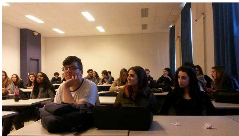
Lycée St Charles à Marseille (mars 2016)

Rencontre avec les secondes et terminales