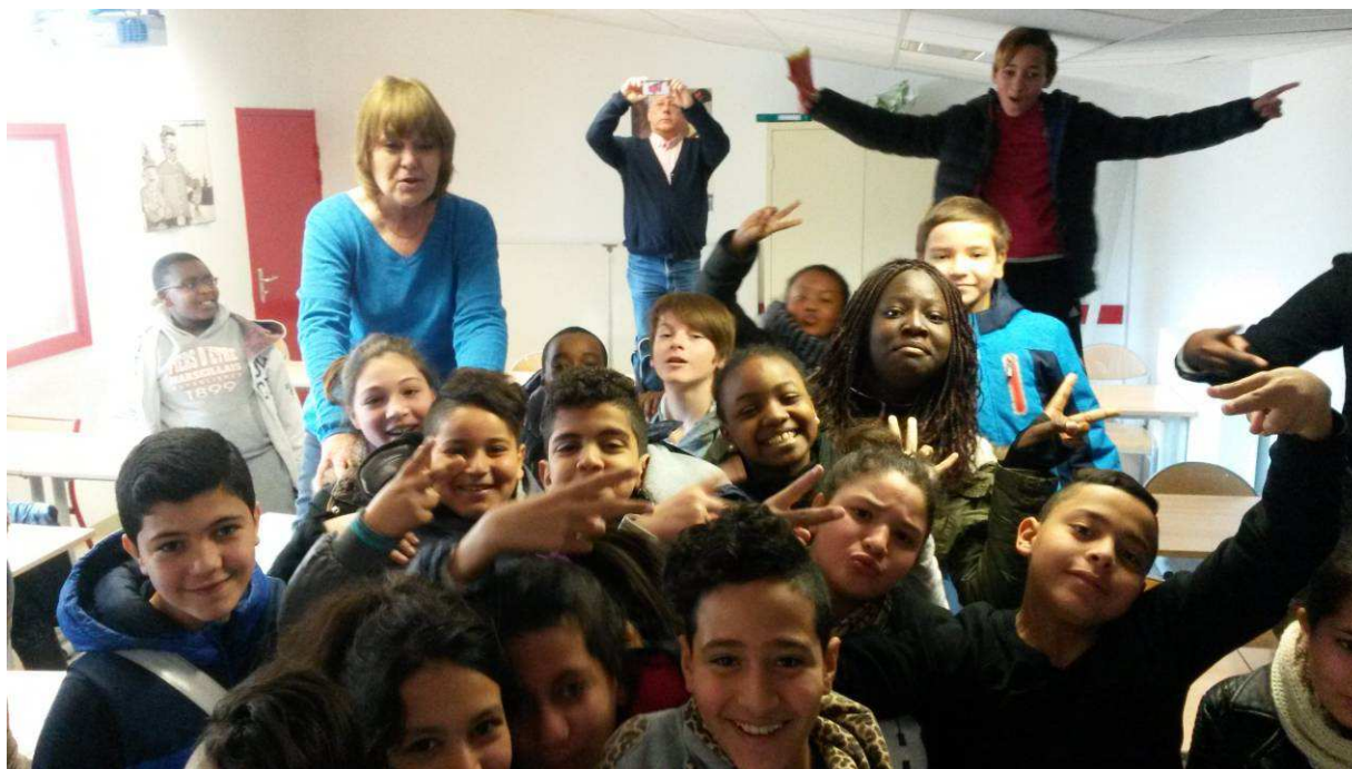
Collège Edgar Quinet à Marseille (mars 2016)

Les élèves réalisent leur Journal Télévisé et des équipes partent en reportage